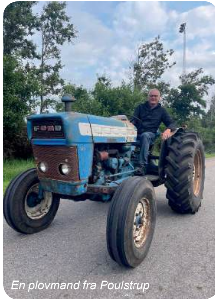
En plovmand fra Poulstrup