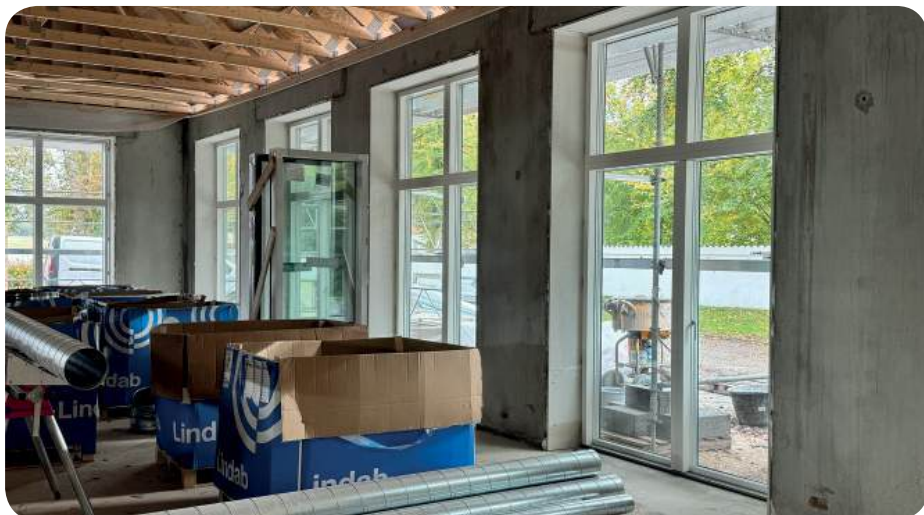
I starten af oktober blev der sat vinduer i Sognegården

salen. Menighedsrådet havde bestilt en kaffemaskine så stor, at den ikke kunne være i køkkenet, men bare rolig vi kommer til at kunne lave kaffe. Der er nu kommet rør til ventilation, og det forlyder at der er mursten på vej, mere om det i næste Lokalblad.