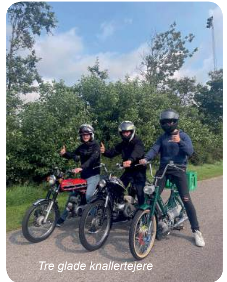
Tre glade knallertejere