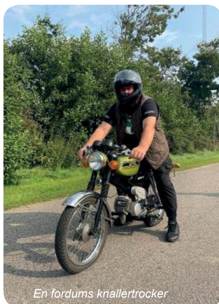
En fordums knallertrocker