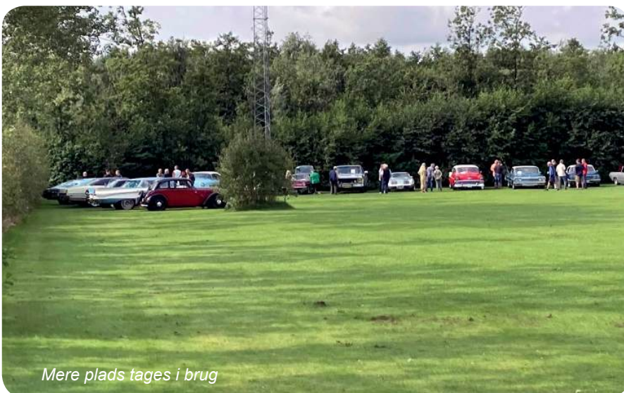
Mere plads tages i brug