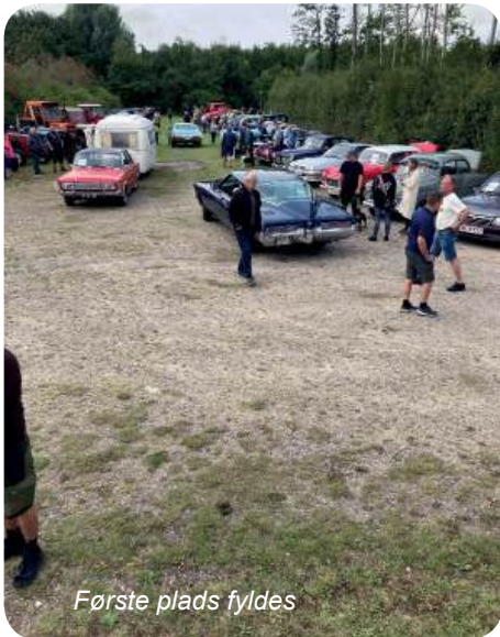
Første plads fyldes