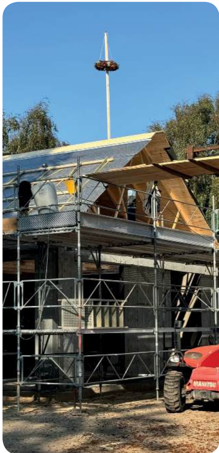
Der blev holdt rejsegilde med flot krans bundet af kirkegårdspersonalet