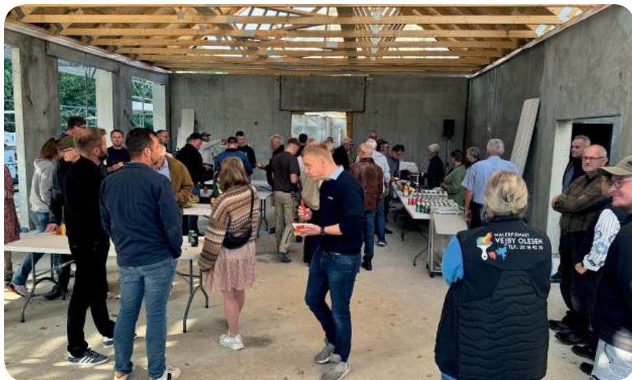
Fra rejsegildet for håndværkere, personale, naboer m.fl. den 23. september

Arkitekt og HP bliver også udfordret. Nogle af hullerne til vinduer passede ikke helt, der skulle også findes plads til højtalere i loftet over