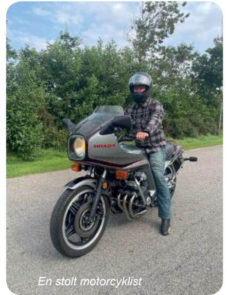
En stolt motorcyklist