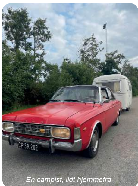
En campist, lidt hjemmefra