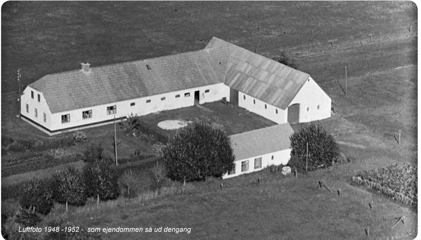
Luffoto 1948 -1952 - som ejendommen så ud dengang