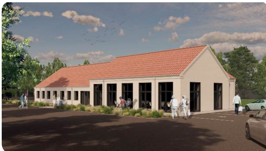
Visualisering af den nye Sognegård i Vrejlev