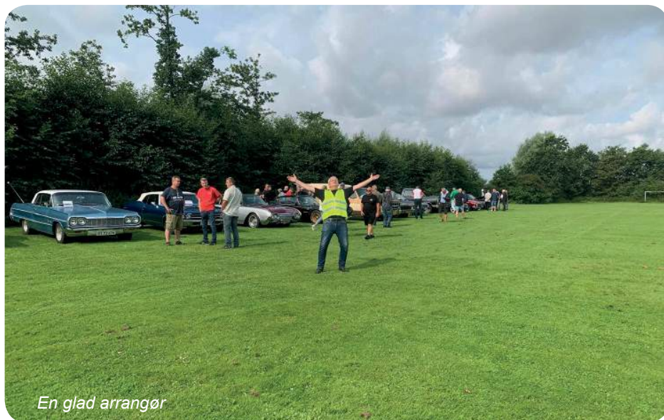
En glad arrangør

Det hele startede med en henvendelse fra nogle lokale "biltosser", med passion for gamle biler. De ville gerne arrangere et lokalt træf for veteranbiler, de syntes at det kunne være sjovt at prøve, om der kunne samles nogle andre med samme kærlighed til de gamle biler, og det skulle være ved Harken Hallen. Der blev hurtigt fundet en dato, søndag den 18. august klokken 10, skulle det løbe af stablen. Der var også blevet udvidet i deltagerfeltet. Nu var alle køretøjer med en alder over 35 år, velkomne til træffet. Der var ingen som havde nogen ide om, hvor mange der ville dukke op på dagen, og der var i første omgang gjort klar nede på pladsen bagved hallen, og oppe ved hallen kunne der så være tohjulede, knallerter og motorcykler. Der var en forventning om at der måske ville komme en 25-30 biler og lidt tohjulede maskiner. Kl. 9 mødte arrangørerne op til en bid morgenbrød i Hallens cafeteria, som holdt åbent i dagens anledning. De var spændte på om der kom nogen, de havde godt hørt at der ville møde nogle frem i løbet af formiddagen. Ligeledes var de der stod i hallens cafeteria, jo også spændte på om der var pølser og kage nok til dagens arrangement. Kl. blev 10 og de første køretøjer begyndte at melde deres ankomst, og de blev ved og ved i en