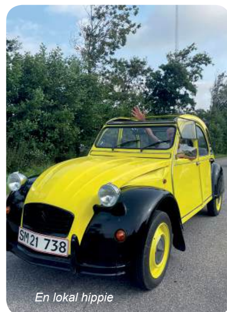
En lokal hippie