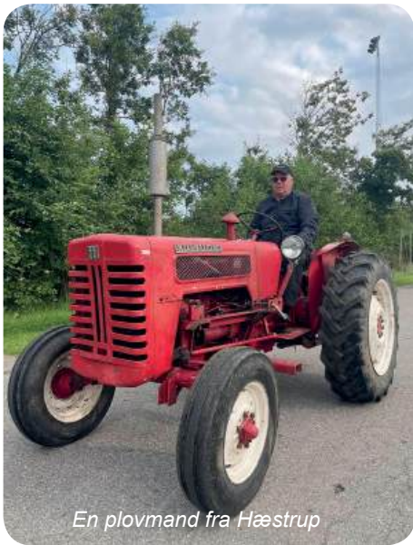
En plovmand fra Hæstrup