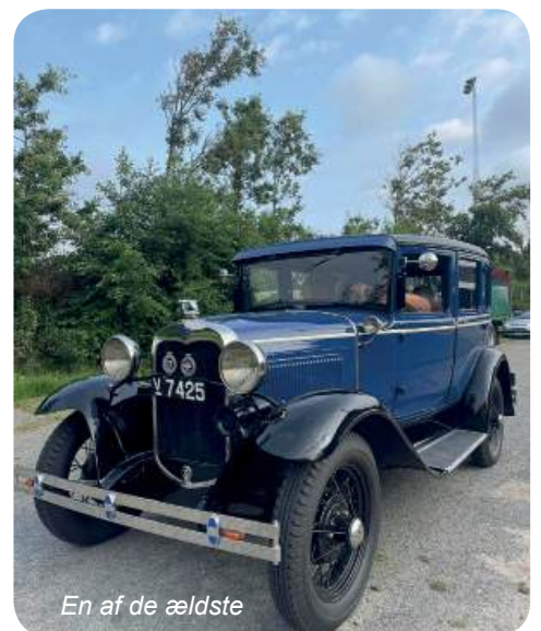
En af de ældste