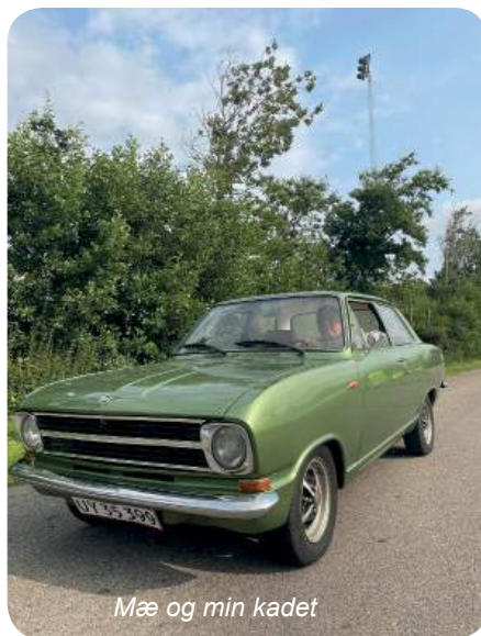
Mæ og min kadet